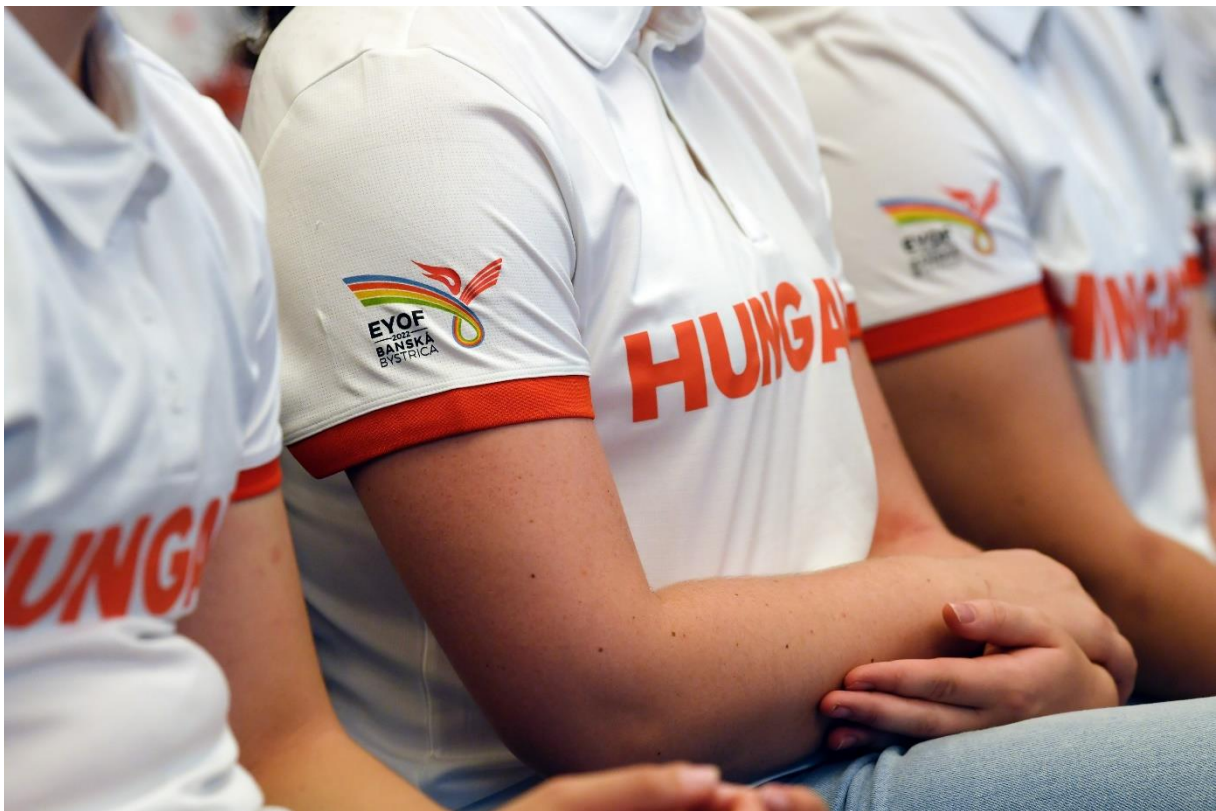
A Magyar Csapat hivatalos ruházatban

A kiutazó csapat biztosítását az olimpiai mozgalom legújabb TOP-partnerével, az Allianzal kötöttük. A korábbiakban megszokott módon prémiumkategóriás utasbiztosítást nyújtottunk minden akkreditált csapattag számára.