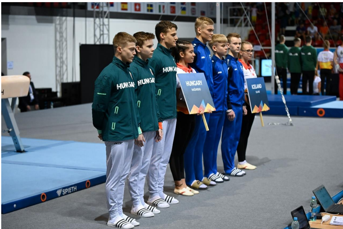
A fiú szertornacsapat