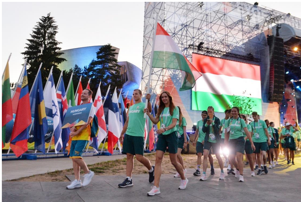
A Magyar Csapat zászlóvivői: Kriszt Sarolta és Kenderesi Péter

Lett volna igény arra, hogy a besztercebányai sportágak átmenjenek Gyetvára a kézilabdacsapatunknak szurkolni, illetve a kézilabdacsapat is szívesen jött volna át a pihenőnapjukon Besztercebányára szurkolni a többi sportágnak, azonban a városok között közlekedő hivatalos transzferbuszok száma és menetrendje nem tette ezt lehetővé.