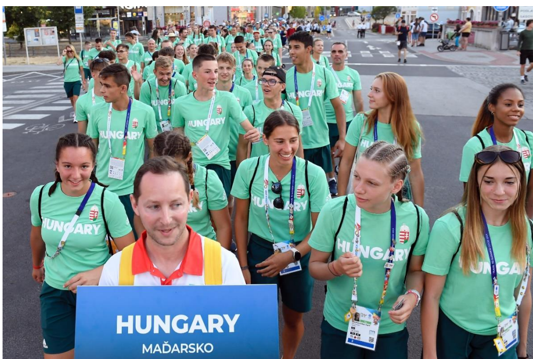
Fiatal sportolók a megnyitőünnepségre vonulva

Az intézményi LinkedIn-oldalunk tartalmát a fogadalomtételtől a záró értékelésig felvezető és összefoglaló cikkekkel frissítettük. „Hoztuk” az átlagos olvasottságot, kiemelkedő elérést nem tapasztaltunk; a 2021 nyarán indított felület követőinek létszáma jelenleg 4250 felett van.