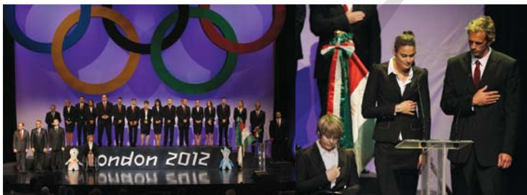
Fogadalmat tett a Magyar Olimpiai Csapat

Kecskeméten a Magyar Olimpiai Akadémia 60. vándorgyűlése