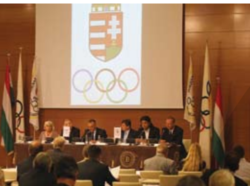
MOB elnökségi ülés után közgyűlés, jóváhagyták az olimpiai csapatot