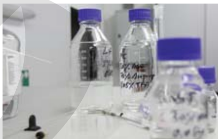
Antidopping: Londonban 1000 ellenőr, naponta 400 vizsgálat – a magyaroknál zéró tolerancia!