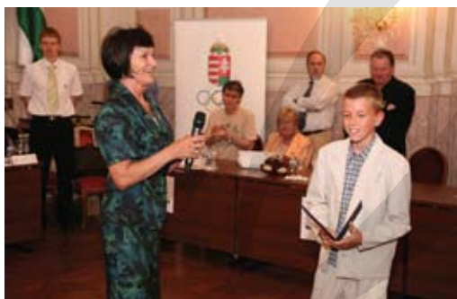
Írány London 2012 - szellemi olimpiatörténelmi vetélkedő