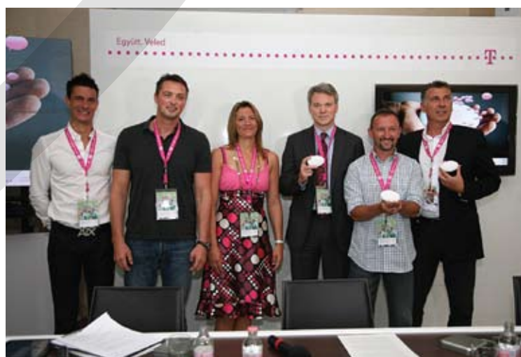
T-Mobile lehetőségek az olimpia jegyében