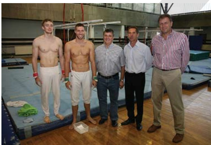
Olimpiai Bajnokok Klubja: látogatás az olimpikonoknál