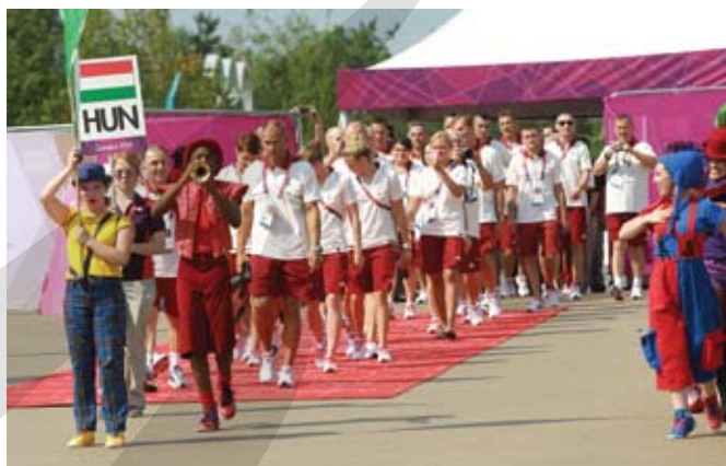
Zászlófelvonás az Olimpiai Faluban