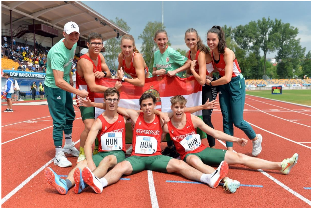
A dobogós atléták: leány és fiú svédváltó

Az EYOF-on elért eredmények értékeléséhez fontos összegezni az egyes sportágak korosztályos nemzetközi versenyeit is, azon belül az EYOF szerepét és helyét. A rendszer, a korosztályok eseményről eseményre változhatnak, muszáj sportági szinten vizsgálni a változásokat. Az alábbiakban az idei helyzeteket vázoltuk, amely több sportág esetében eltér az előző EYOF-versenyek kiírásaitól, leginkább a járvány adta helyzet miatt.