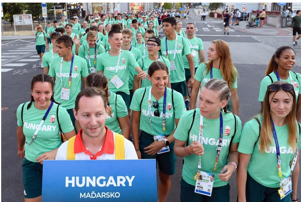
Fiatal sportolók a megnyitóünnepségre vonulva

A Magyarock TikTok-oldalán a legtöbb megtekintés a nyitóünnepségre vonuló, jókedvű magyar különítményt bemutató tartalomra érkezett ebben az időszakban, 65 500 lejátszást generálva. Kedvelések tekintetében is ez bizonyult elsőnek, 9 826 like-ot gyűjtve. Jelen sorok írásakor 36 300 követőnk van a TikTok-on.