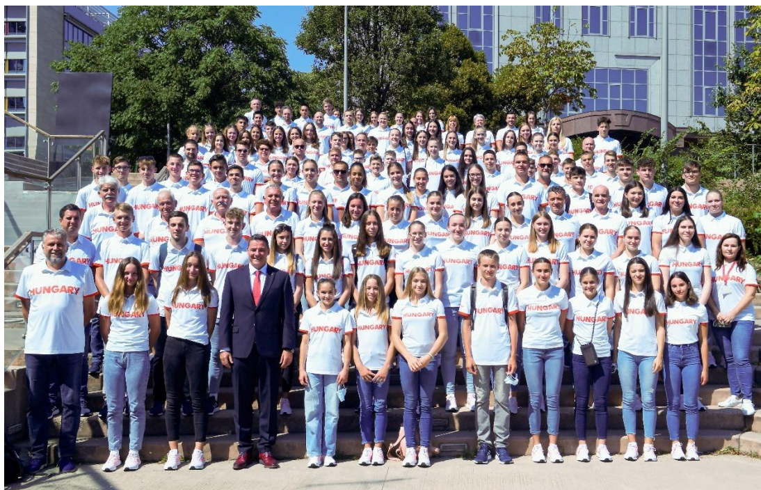
Magyar Csapat a fogadalomtételen

0 = nem szerepelt magyar sportoló, - = nem szerepelt programon a szakág