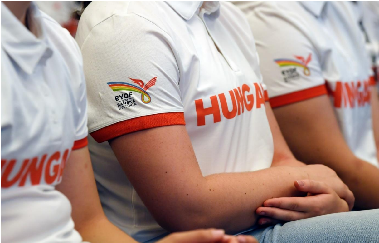
A Magyar Csapat hivatalos ruházatban