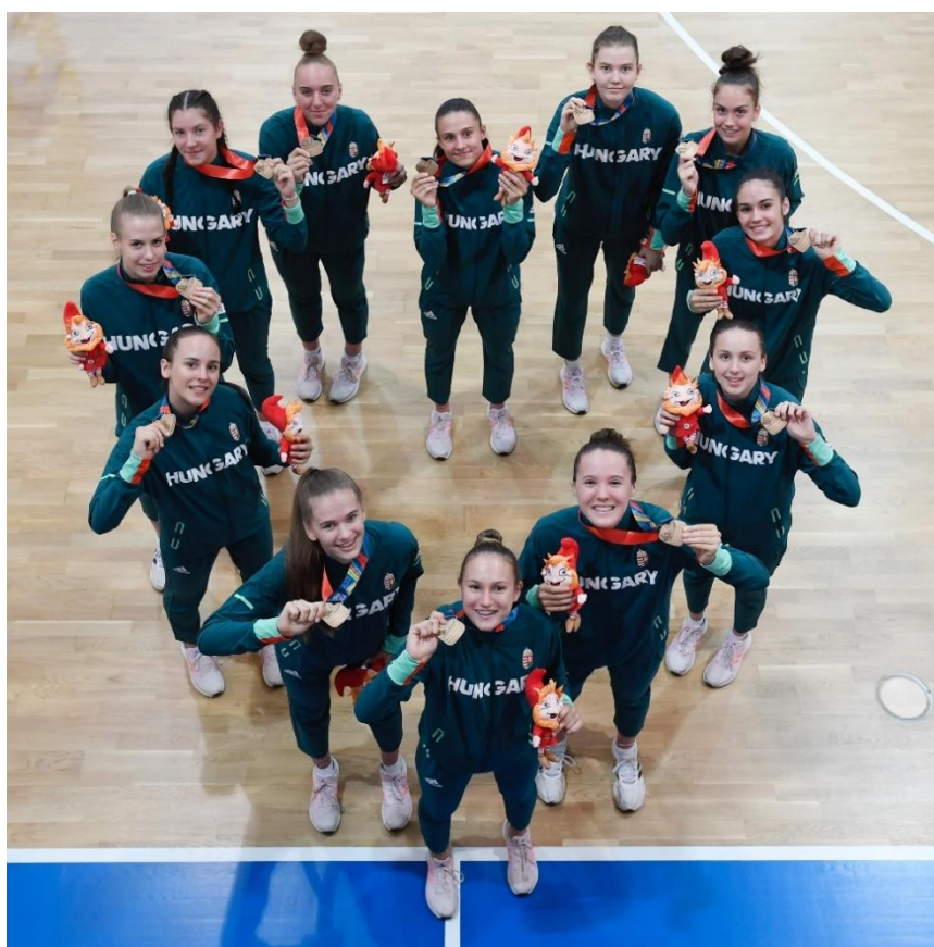
A fiatal, bronzérmes leány kosárlabda-válogatott

Megvizsgáltuk a korosztályok sportágankénti megoszlását a versenykiírási szabályokkal összevetve. Az érési különbözőségekből adódóan az utánpótláscsapatokra, a válogatottakra szignifikánsan jellemző, hogy az adott korosztályon belül az idősebb sportolók – azon belül is az év első felében születettek – aránya magasabb. Ezek a nemzetközi tendenciák csak részben igazak az idei magyar nyári EYOF-csapatra. A két évet átfedő korcsoporton belül láthatóan több sportoló kerül ki az idősebb korosztályból (60 fő) mint a fiatalabból (34 fő). Torna sportágban a fiúknál a versenykiírás három évet fedett le, itt másfél-másfél éves elosztással számoltunk. A fiúk esetében egyértelműen az idősebb korosztály képviselte magát a sportágakban (9-24 fő), míg a leányoknál kiegyenlítettebb volt az eloszlás a két évjárat között, de itt is az idősebbek voltak többen (25-36 fő).