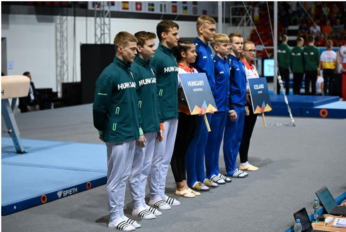
A fú szertornacsapat