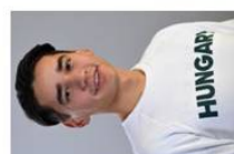
Liu Shaolin Sándor