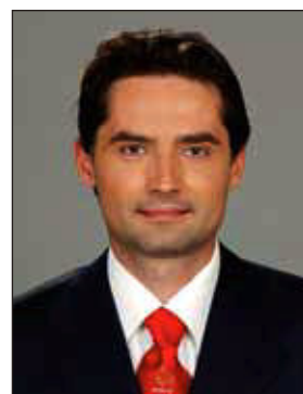
Török Olivér műsorvezető