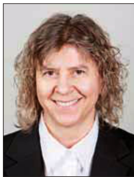
Morvai Katalin Heti Válasz