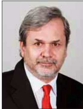
Földi Imre MTI