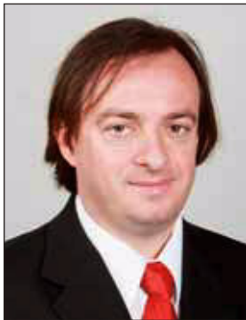
Illyés Tibor MTI