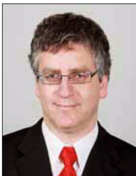
Kövesdi Péter Független Hírügynökség