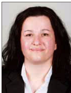
Lódi Renáta MTI