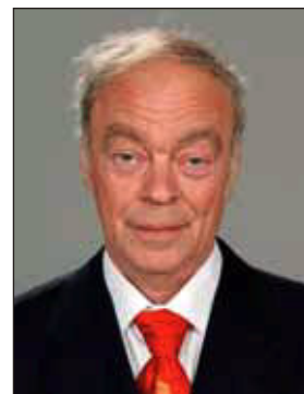
Baló György műsorvezető