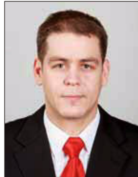
Gyuricza Róbert MTI