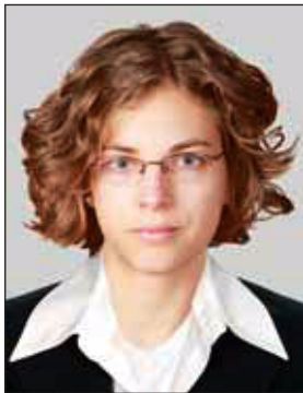
Kelemen Nóra mob.hu