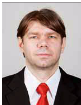
Ambrus Gábor MTI