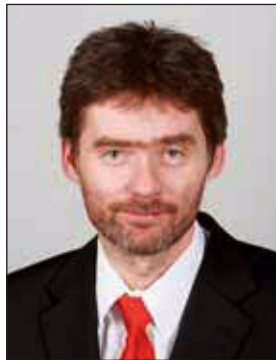
Koszticsák Szilárd MTI