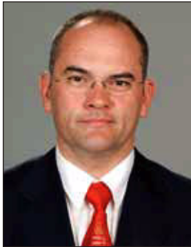
Gundel Takács Gábor kommentátor