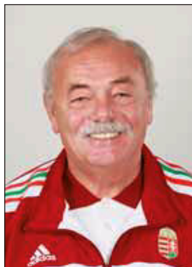
Pálvölgyi Miklós férfi szövetségi kapitány